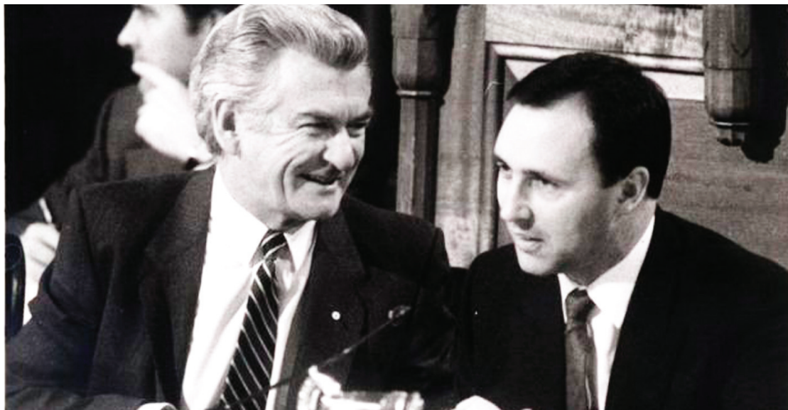
鲍勃·霍克(Bob Hawke, 左)和保罗·基庭(Paul Keating, 右)。

通货膨胀带来的不确定性，会给政府和企业制定劳动力成本预算的时候带来非常大的困难。通胀带来的收入差距的反复拉大，对劳资关系也非常不利。随之而来的是人们对经济的信心下滑，也